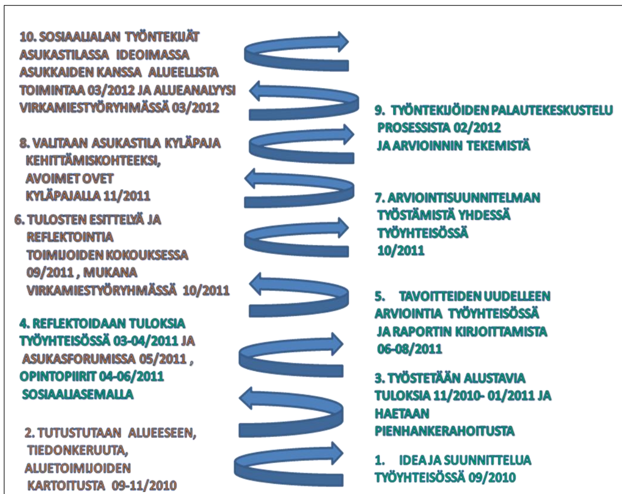
Kuvio 1. Työskentelyprosessi hankkeen aikana